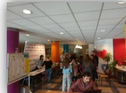
Akademia Finansów i Biznesu Vistula w Warszawie