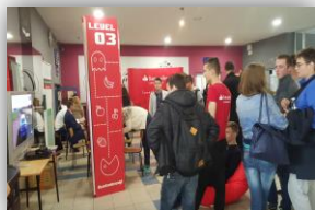
Wyższa Szkoła Informatyki i Zarządzania w Rzeszowie