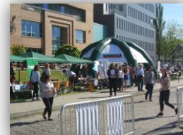
Uniwersytet Kardynała Stefana Wyszyńskiego w Warszawie